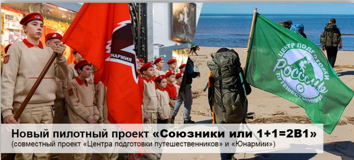
Новый пилотный проект «Союзники или 1+1=2В1» (совместный проект «Центра подготовки путешественников» и «Юнармии»)