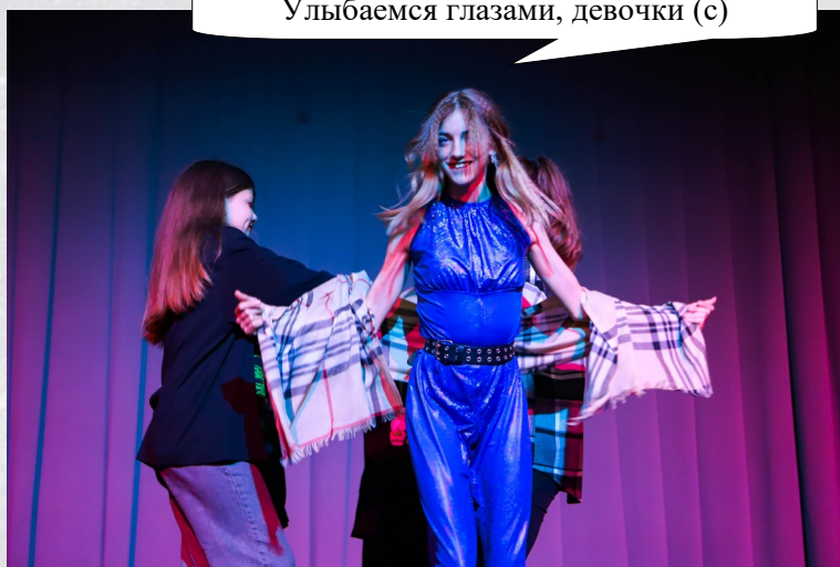
Улыбаемся глазами, девочки (с)