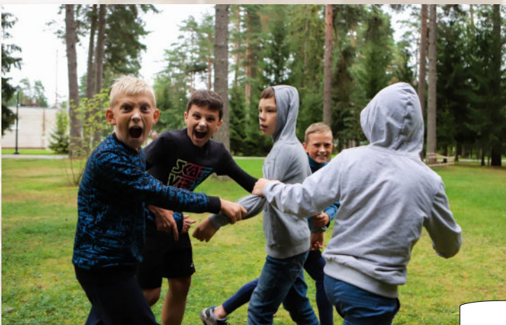
Вон там один бегае