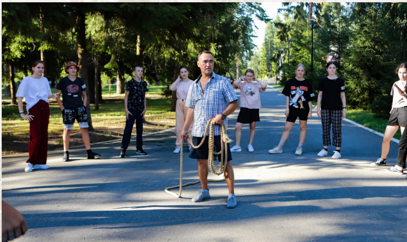
Соблаговолите взглянуть на россоньцев