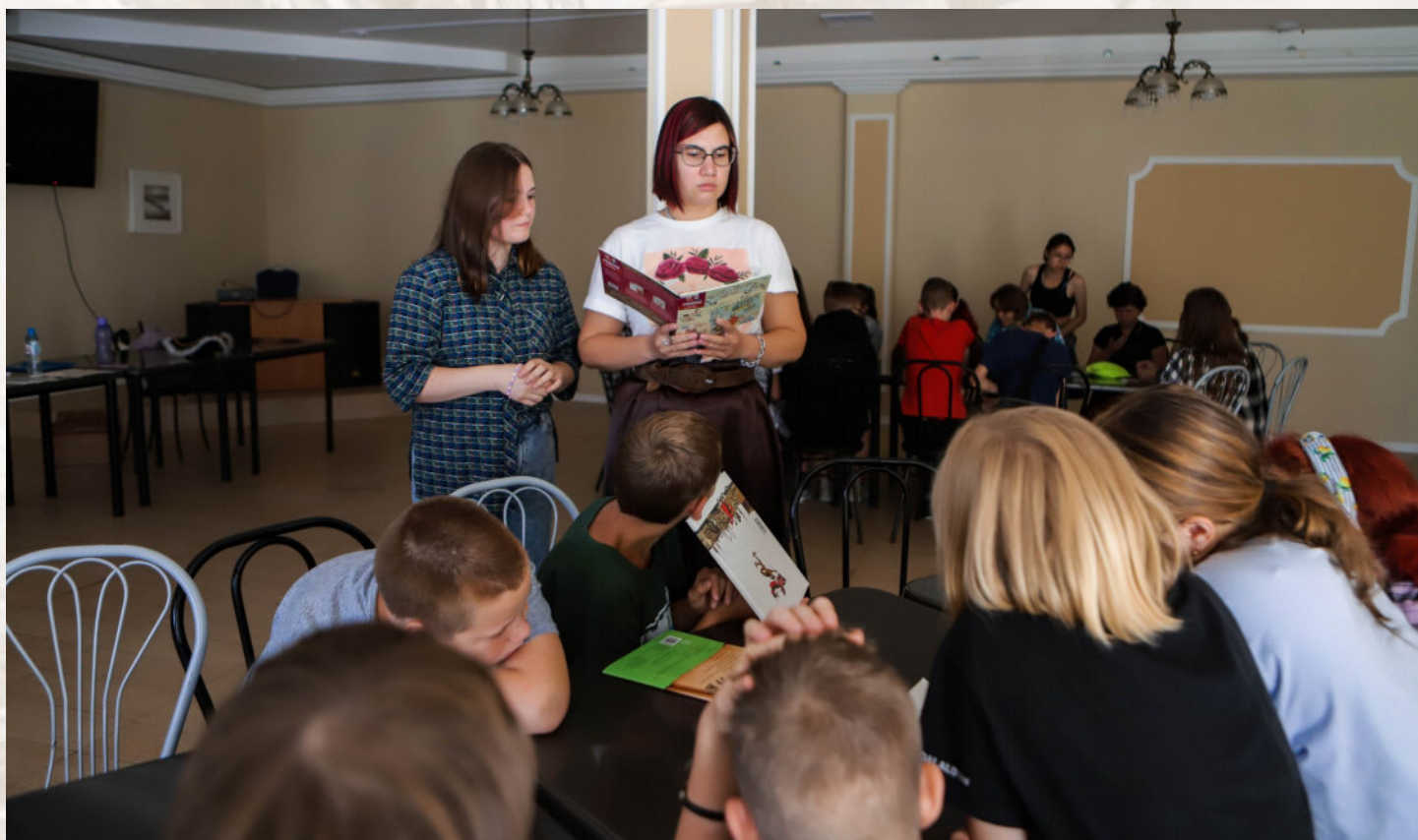
Россонъцы проверили свои знания в увлекательной викторине «О царе Петре и его времени»