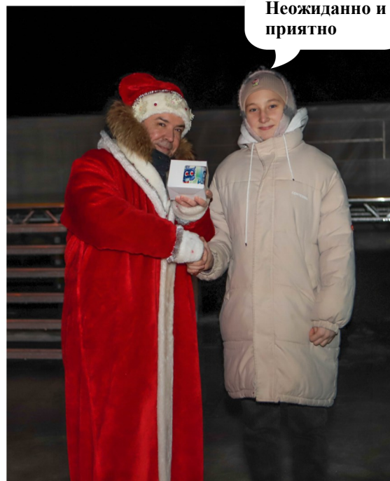
Неожиданно и приятно