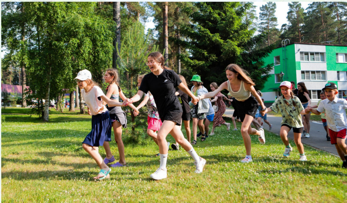
РАЗНЫЕ ЦВЕТА, ОДНА КОМАНДА