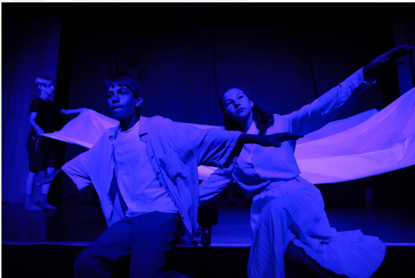
МАРК ШАГАЛ. «НАД ГОРОДОМ» 1918