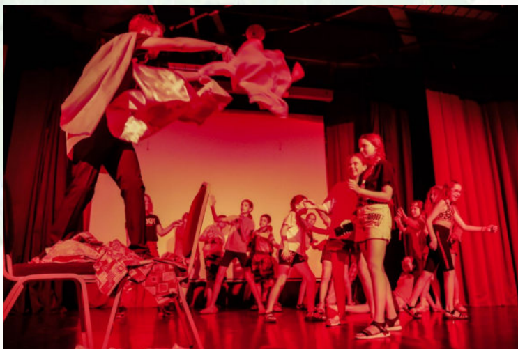
«ПОСЛЕДНИЙ ДЕНЬ ОТРЯДА»