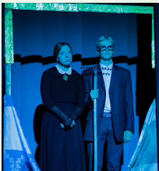
ГРАНТ ВУД. «АМЕРИКАНСКАЯ ГОТИКА», 1930