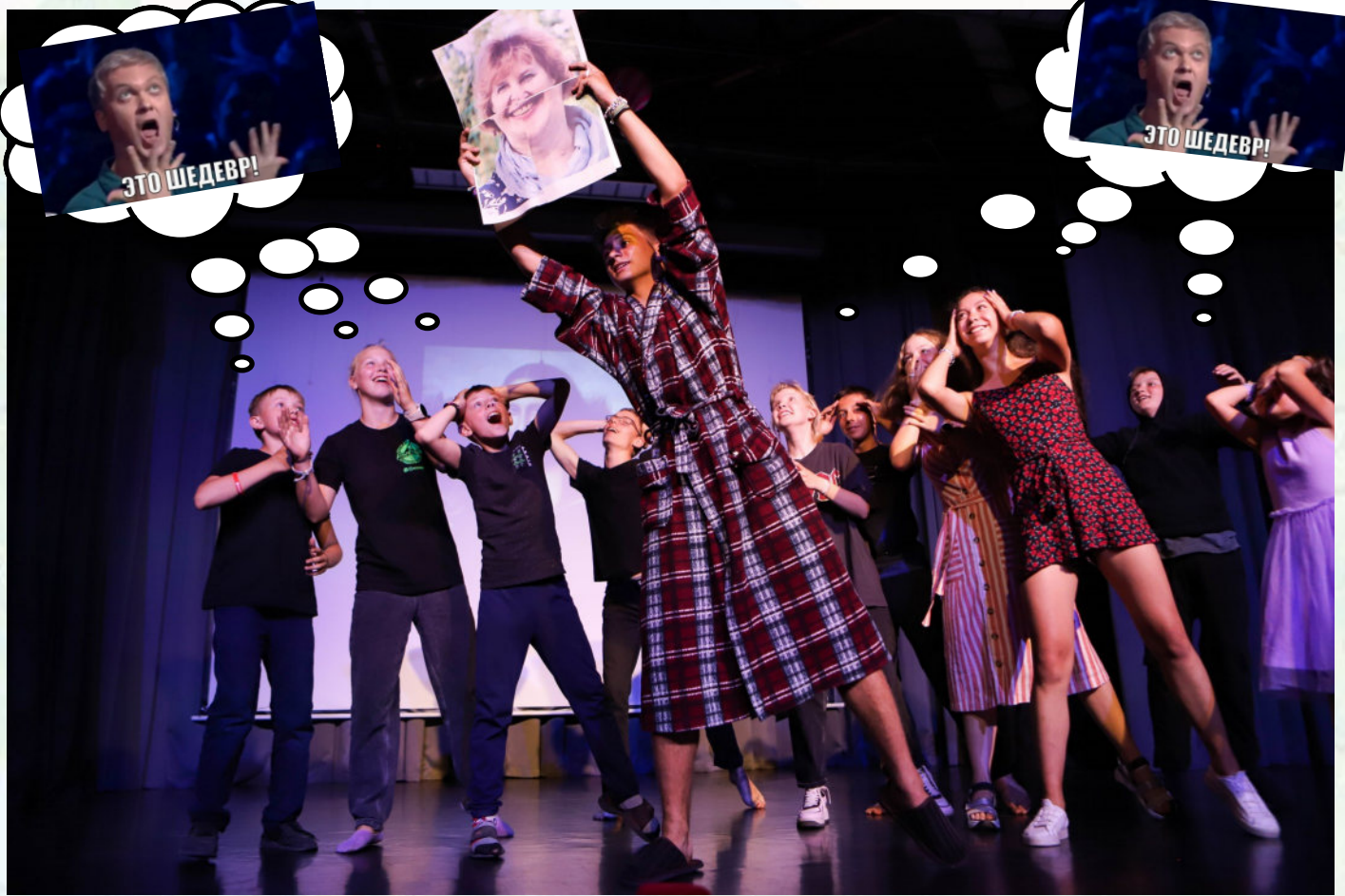
ЛЕОНАРДО ДА ВИНЧИ И ЕГО ДЖОКОНДА, 1503