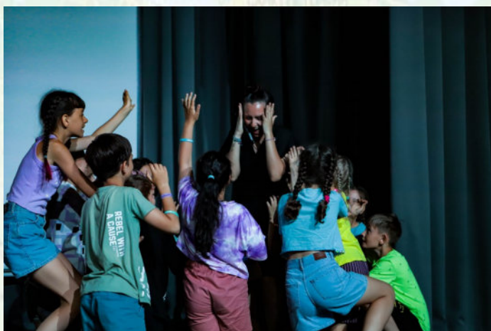
ЭДВАРД МУНК. «КРИК ВОЖАТОГО», 1893