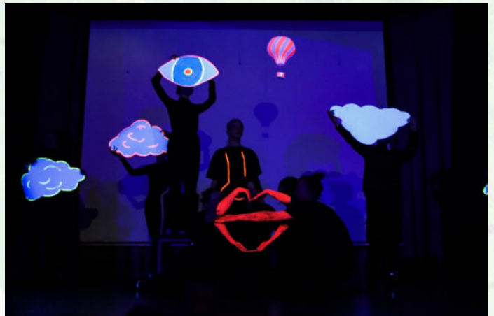
Сюрреализм РЕНЕ МАГРИТТА