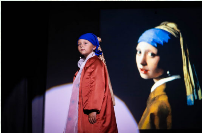
ЯН ВЕРМЕЕР. «ДЕВУШКА С ЖЕМЧУЖНОЙ СЕРЕЖКОЙ»