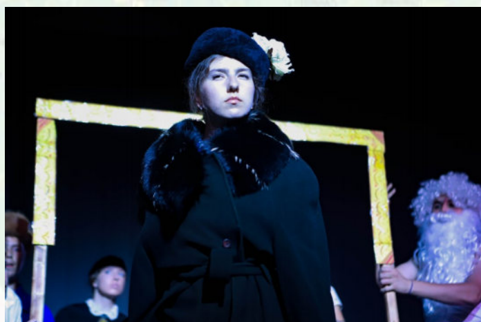
ИВАН КРАМСКОЙ. «НЕИЗВЕСТНАЯ ПОДОЗРЕВАКА», 1883