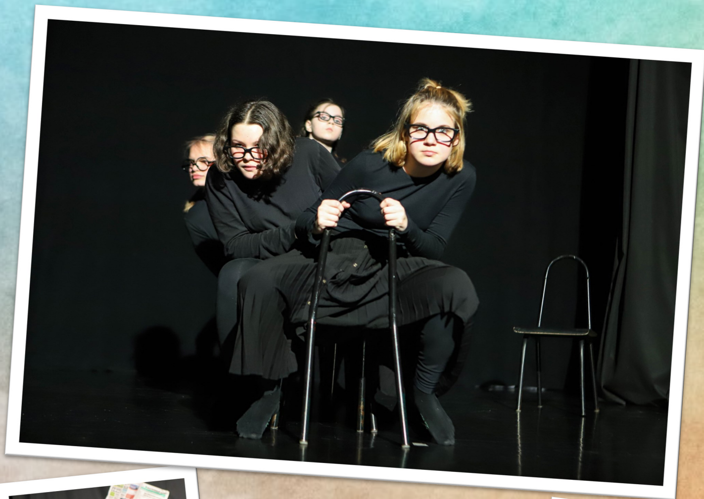
Изящность и грация