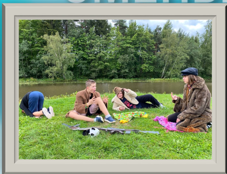
«Охотники на привале»