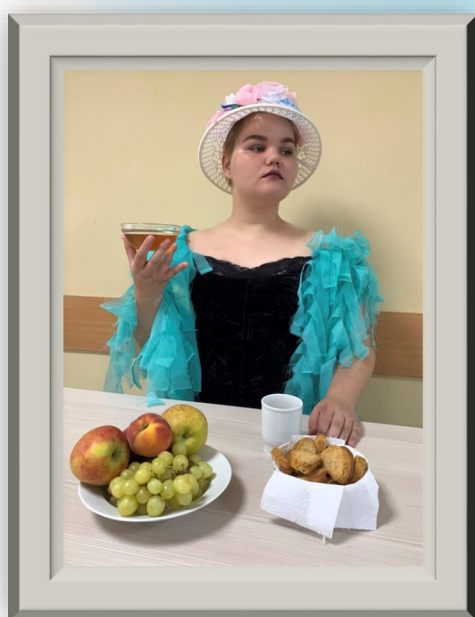
«Купчиха за чаем»

Турбины работают, запас хода еще на многие тысячи километров, а это значит, что веселье на нашем лайнере продолжается. Сегодня прошла игра «фотокросс», где россоныцам предлагалось повторить картины известных художников.