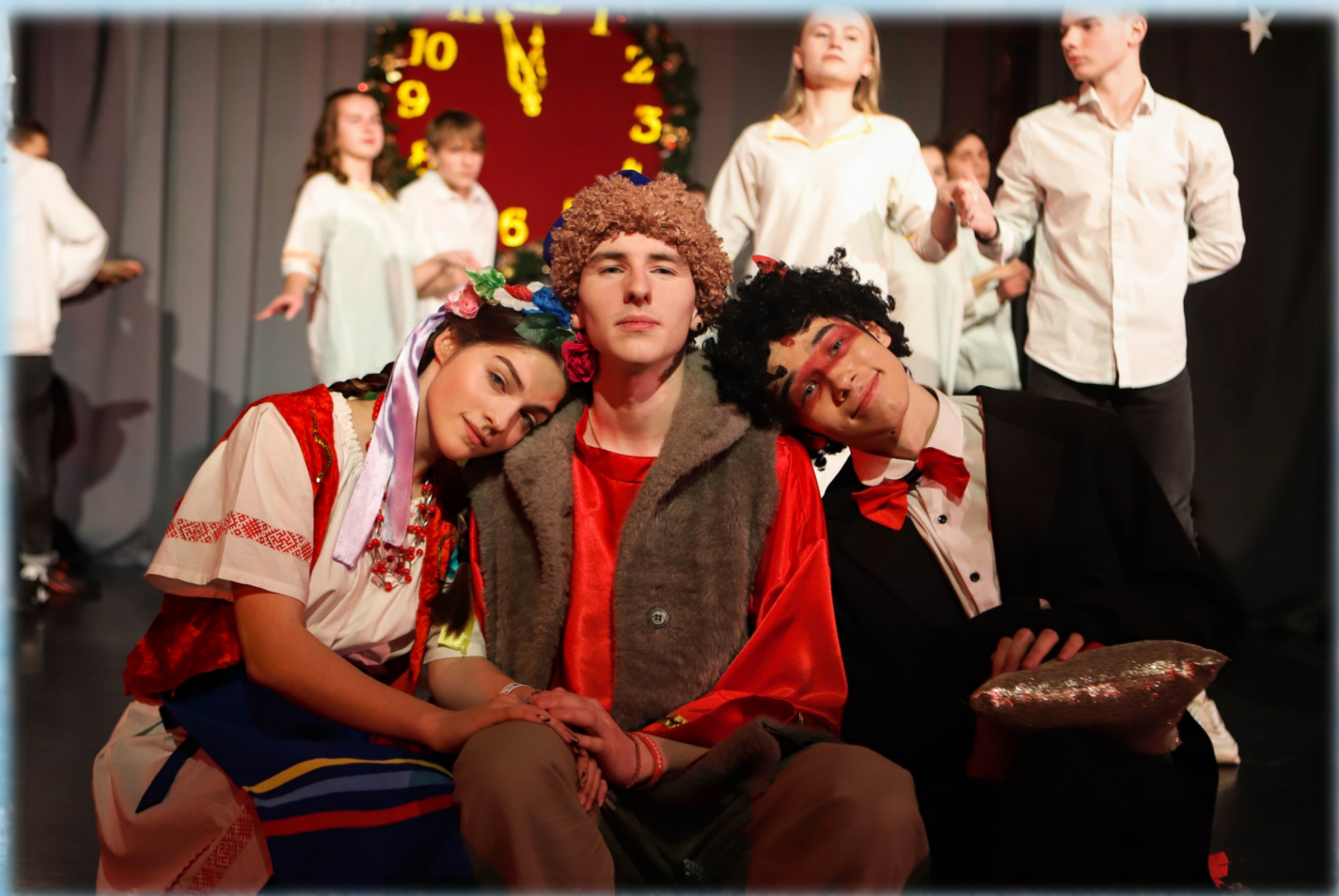
Кум и Чум встречаются первыми

Значит, последний рейс этой зимой — полёт в удивительную страну, да полёт не обычный, а на самом чёрте! Чистые, словно лазурь, небеса и поля золотые ждут нас на Украине!