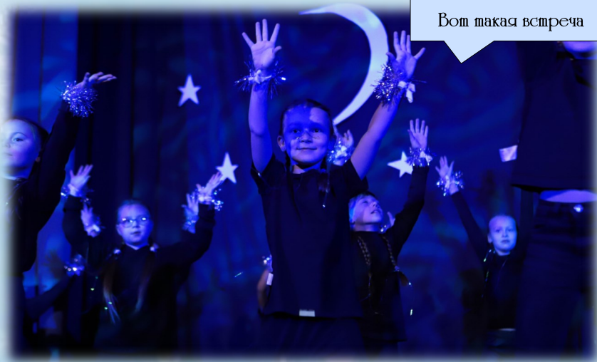
Вот такая встреча

Мы связаны с Украиной теснее, чем с какой-либо другой страной: у многих есть украинские корни или родственники, нас объединяет кириллица и интуитивно понятная речь, а украинская культура так же зреет наше сердце, как своя собственная. Значит, и приезд нужно обязательно отметить сытным обедом и душевными разговорами:)