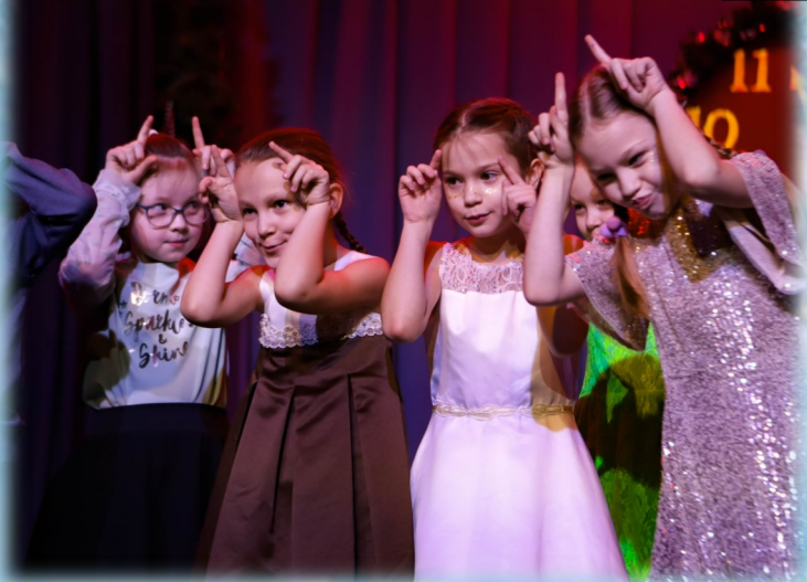
Милонга — стремительный и жизнерадостный танец. Учимся