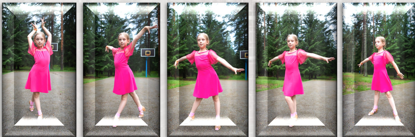
Зажигательный «Ча-ча-ча» в десять шагов

Если ваша жажда познаний бьёт через край — дайте ей волю и пуститесь в пляс! Мастер-классы от ваших товарищей-россоныцев — каждый день в Дневнике смены!