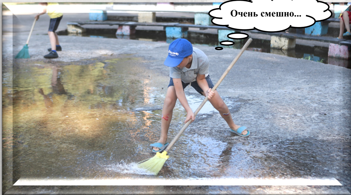
В поисках Лох-Несского чудовища