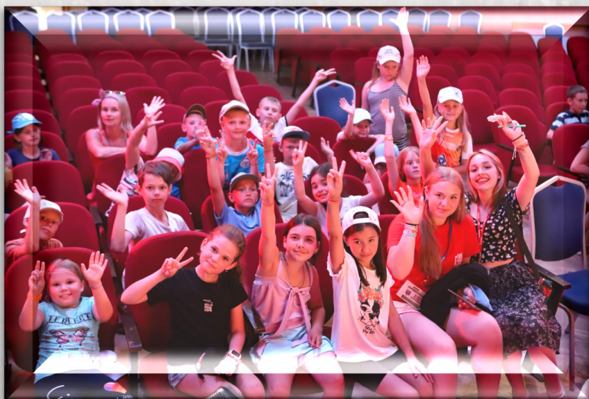
Совершенствование проекта идёт большой командой

Наш проект «Россонь» не находится под грифом секретности и известен всем, кто однажды бывал тут, а также всем, кто знаком с россоньцами. Именно так себя называют те, кто причастен к проекту. День Россони отмечается как большой праздник, состоящий из схем огромного веселья и неповторимых эмоций. Расскажите всем, кого знаете и присоединяйтесь к разработке.