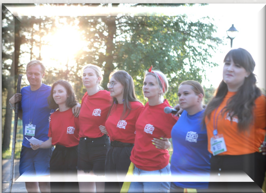
Менторы есть у каждой группы инженеров, называемой «отрядом». Они отвечают за организацию настроения юных инженеров и тщательно следят за их прекрасным самочувствием